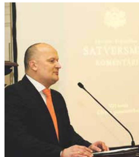
Grāmatas Latvijas republikas Satversmes komentāri. 8.nodaļa atvēršanas svētkos LU Mazajā aulā.

tēva māsu ar ģimeni izsūtīja uz Sibīriju. Vectēvam pašam bija četri dēli, un interesanti, ka divi no viņiem kļuva pārliecināti komunisti. Viens no tiem bija mans tēvs.