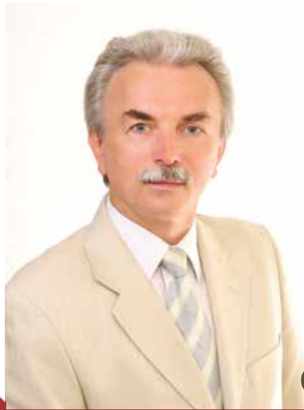
Dzimis 1960. gadā. Latvijas Universitātes Juridiskās fakultātes lektors Krimināltiesisko zinātņu katedrā.