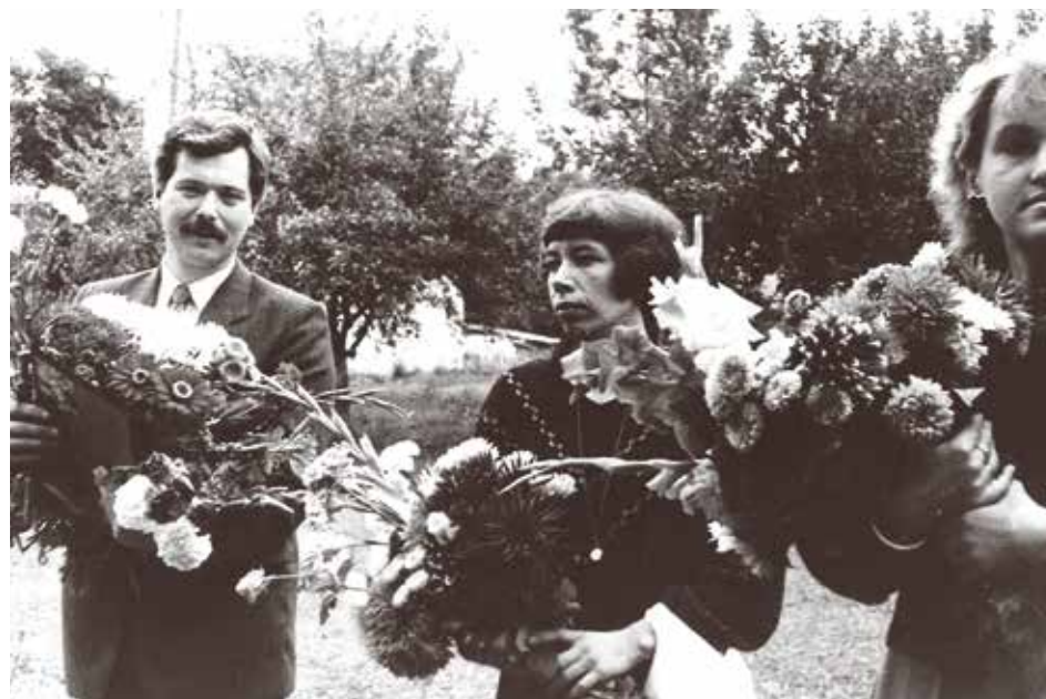
1988. gada 1. septembris. Ogresgala pamatskolas direktors ar kolēģēm.

dētāju. Nodibinājuma galvenais mērķis ir rehabilitācijas un sociālā centra būvniecība un tā darbības nodrošināšana, kā arī rehabilitācija un sociālo pakalpojumu sniegšana sportistiem, sporta veterāniem, Alojās novada iedzīvotājiem un citiem interesentiem. Sporta rehabilitācijas centrs ir būtiskākais no visiem plānotajiem objektiem. Paredzēts, ka tieši sporta rehabilitācijas centra darbība būs