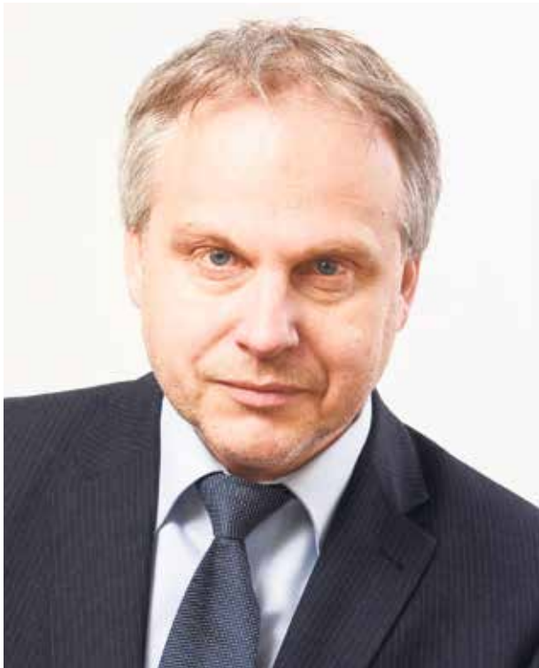
ROMĀNS MEŽECKIS "No sirds Latvijai" deputāta kandidāts.

Beidzis Latvijas Universitātes Juridisko fakultāti. Bijis Latvijas Jaunatnes padomes pirmais prezidents, vēlāk arī Rīgas domes un 7. Saeimas deputāts. Strādājis vairāku Latvijas lielo uzņēmumu vadībā. Pašvaldību vēlēšanās 2013. gadā ievēlēts par Jūrmalas domes priekšsēdētāja vietnieku. Vaļasprieki – basketbols un kalnu slēpošana.