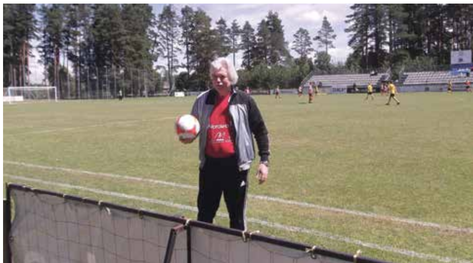
2014. gada pavasarī Staicelē, Futbola dienā.

Ja mani ievēlēs Saeimā un līdz tās darba sākumam Pilgrima ceļu nepaspēšu noiet, tad atlikšu to uz nākamo gadu, un ar visu sirdi un atbildību nodošos deputāta darbam. Jebkurā gadījumā savu dzīves turpinājumu gaidu ar interesi un pozitīvu skatienu pasaulē. Ar pesimismu nedrīkst dzīvot ne mirkli, jo tad var iedzīvoties depresijā, bet uzņēmējs nedrīkst būt depresīvs – viņam visu laiku jābūt optimistam. Biznesā, tāpat kā politikā, katru dienu piedzīvojam kādas negācijas, nekas neiet gludi un viegli, bet nedrīkst padoties, nolaist rokas un krist pesimismā. Tad ir vāks! Bet mēs taču dzīvojam, lai uzvarētu un mums labi klātos. Un tā arī notiks!”