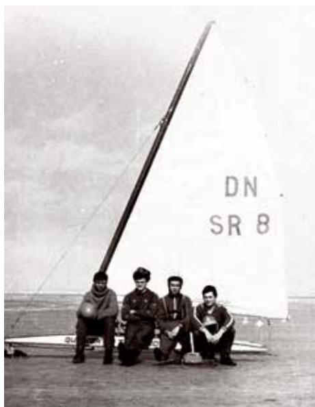
1976. gada ziemā PSRS Bruņoto spēku izlases sastāvā, pie Amūras liča.

Mani biznesa partneri, kas arī vēlas, lai valsts tiktu sakārtota, uzņēmumā šobrīd iztiek bez manis, tādējādi atbalstot mani, lai varu strādāt rītdienas valstij. Tikai vienu dienu nedēļā esmu firmā, kur izpildu pienākumus savā uzņēmumā, bet esmu drošs, ka manas prombūtnes laikā tur viss ir kārtībā. Visi uzņēmēji, ar kuriem esmu runājis, grib, lai valsts tiktu sakārtota. Kāds visu laiku cenšas iestāstīt, ka mūsu uzņēmēji ir negodīgi, cenšas apiet nodokļu nomaksas. Tā nav taisnība! Viņi visu laiku nāk ar priekšlikumiem, kādi likumi un normatīvi jāsakārto, lai būtu izdevīgi valstij maksāt nodokļus, un viņi grib to darīt godīgi.