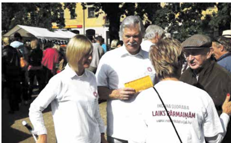
Šogad Zemgales piena svētkos.

Ūdeņi man vienmēr bijuši tuvi, jo Bolderājā atradās arī Centrālais jahtklubs. Diemžēl sen neesmu burājis, jo burāšanai jāziedo laiks, kura man nav, bet mani mīt sapnis nobraukt ar jahtu pa Vidusjūru no Barselonas līdz Gibraltāram. Tas būtu super! Sapņu man ir daudz, bet pirmais un svarīgākais – sakārtot Latviju. Ja tas mums izdosies, tad visi varēs piepildīt savus rozā sapņus.